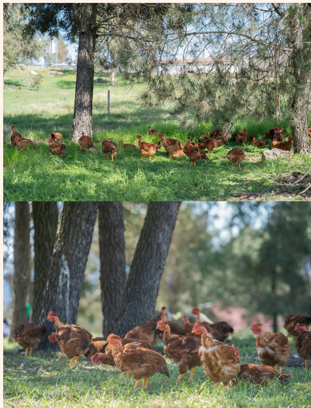
NO PARQUE EXTERIOR